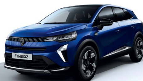
כחול עמוק מטאלי RQH