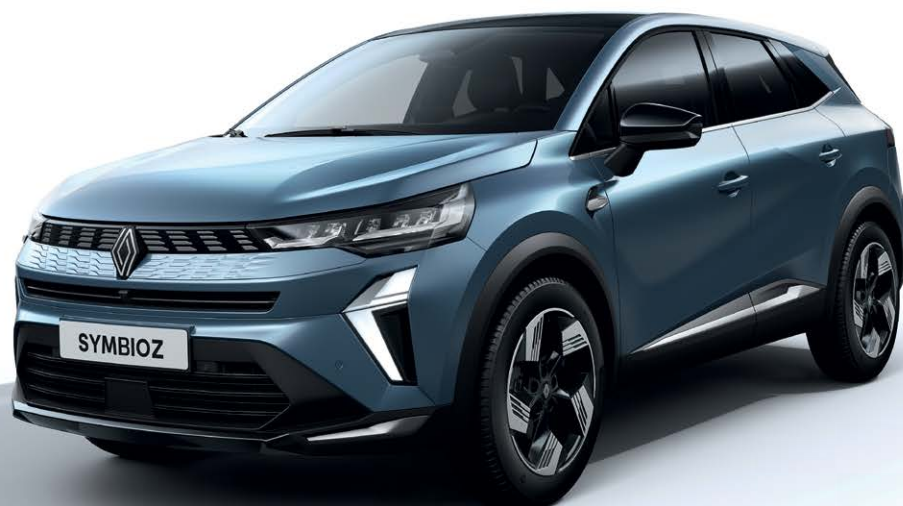
כחול טורקיז מטאלי RRM