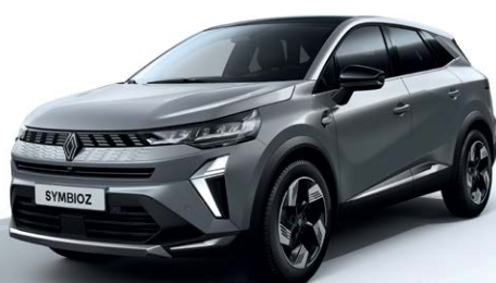
אפור בטון מטאלי KNJ