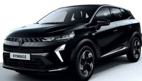
שחור מטאלי GNE