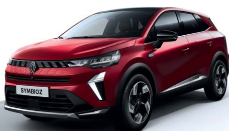
אדום מטאלי NNP