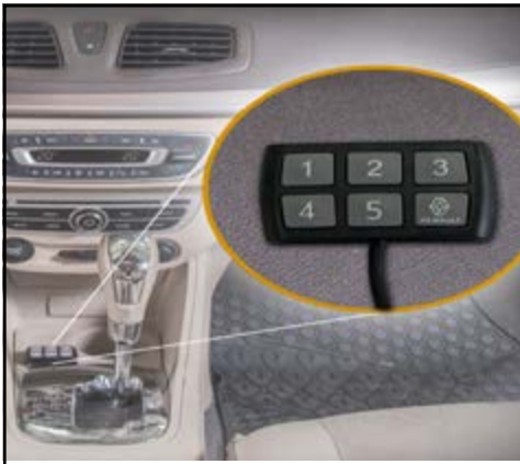
קודן משבת התנעה חכם למניעת גניבות. LP00000045