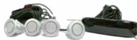
מערכת התראה - חיישן רוורס 4 חיישנים צג רגיל התראה ויזואלית באמצעות צג LCD המורכב מ-3 צבעים ובמרכזו צג דיגיטלי המציג את מרחק/טווח הנסיעה לאחור. LP00000021

האביזרים המופיעים בעמוד זה הינם בתשלום נוסף.