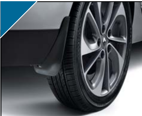
סט מגיני בוץ מגן על הרכב מפני נזקי בוץ וחצץ. אינו מתאים לדגם GRAND. קדמי LP00008502, אחורי LP00008503