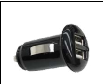
מטען מצת 2.1 אמפר 2 כניסות USB להטענת כל סוגי המכשירים. LP00007192