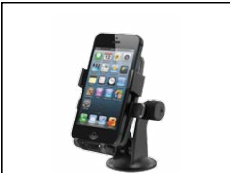
תושבת איכותית לסמארטפון נצמדת לשמשה/לרשבורד, תמיכה במכשירים עד 5 אינץ'. LP00007190

אתה מוזמן לאבזר את הרכב שלך ולהפוך אותו לייחודי, עם מגוון אביזרים לבחירה: