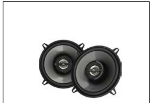
זוג רמקולים אחוריים איכותיים LP00007092