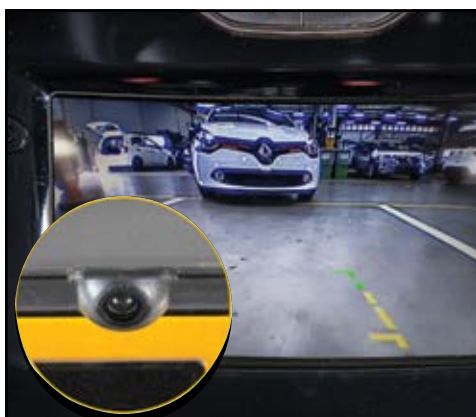
מתאם למצלמת רוורס מאפשר לראות על מסך הרכב המקורי את המצלמה האחורית. LP00011583

אתה מוזמן לאבזר את הרכב שלך ולהפוך אותו לייחודי, עם מגוון אביזרים לבחירה: