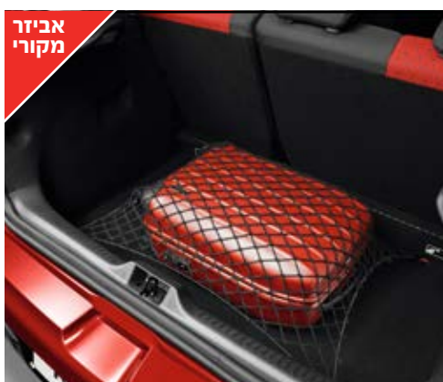
רשת חפצים לתא מטען/אופקית למניעת תנודת החפצים בזמן נסיעה, ארגון וסדר בתא מטען. LP00012538 / LP00007301