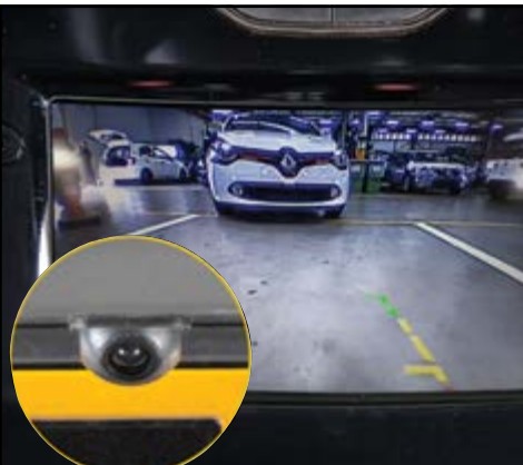
מתאם למצלמת רוורס מאפשר לראות על מסך הרכב המקורי את המצלמה האחורית. LP00011583