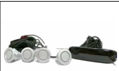
מערכת התראה - חיישן רוורס 4 חיישנים צג רגיל התראה ויזואלית באמצעות צג LCD המורכב מ-3 צבעים ובמרכזו צג דיגיטלי המציג את מרחק/טווח הנסיעה לאחור. LP00000021