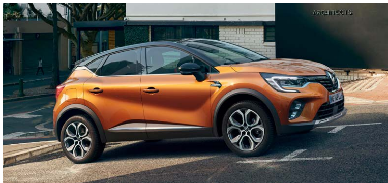
1.33 ל' טורבו בנדין אוט' LIGHT HYBRID EXECUTIVE