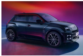
שחור פס קישוט אדום