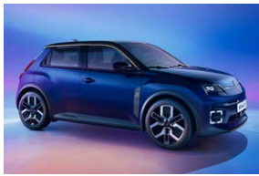
כחול עם גג שחור פס קישוט כרום