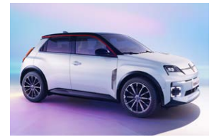
לבן עם גג שחור פס קישוט אדום