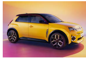
צהוב עם גג שחור פס קישוט אדום