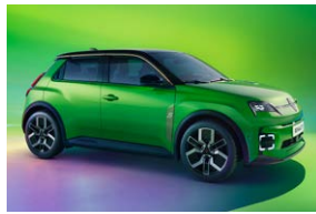
ירוק עם גג שחור פס קישוט כרום