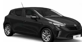
שחור פנינה מטאלי